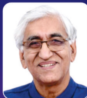
विशिष्ट अतिथि मान. टी.एस. सिंह देव पूर्व स्वास्थ्य मंत्री छत्तीसगढ़