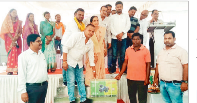
शिविर में सामग्री वितरण करते जिप अध्यक्ष।

जनपद पंचायत पोड़ी उपरोड़ा के ग्राम कोरबी में समाधान शिविर का आयोजन किया गया। जिसमें कोरबी, सरमा, तनेरा, पुटीपरखार, हरदेवा, पाली, बुढ़ापारा, कुल्हारिया, खम्हारमुड़ा, झिनपुरी एवं मिसिया ग्राम पंचायतें शामिल रही। इस शिविर में कुल 4126 आवेदन प्राप्त हुए, जिनमें से 2320 आवेदनों का मौके पर ही त्वरित निराकरण कर दिया गया।