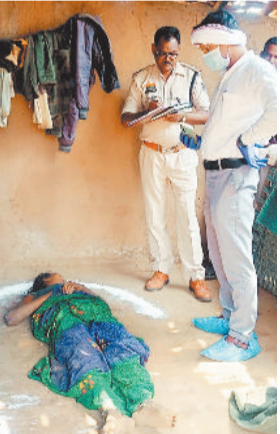
मृत महिला, विवेचना करती पुलिस।