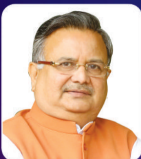
अध्यक्षता मान. डॉ. रमन सिंह विधानसभा अध्यक्ष छत्तीसगढ़

Hotel Babylon Capital, VIP Chowk, Raipur (C.G.)