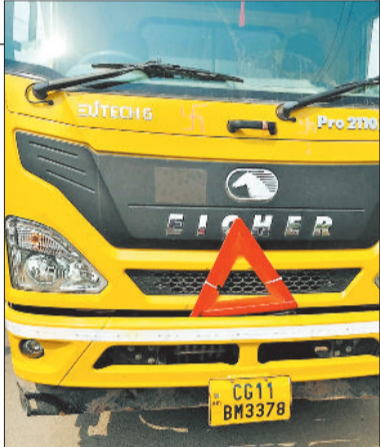
दुर्घटनाकारित मिनी ट्रक।

■ बालको थाना क्षेत्र अंतर्गत लालघाट शराब भट्टी के पास घटित हुई घटना