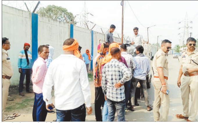
युवकों को समझाईश देती पुलिस।

घटना के बाद लोगों की भारी भीड़ घटनास्थल पर एकत्रित हो गई थी और चक्काजाम करने का प्रयास हो रहा था लेकिन पुलिस की टीम तत्काल मौके पर पहुंची और