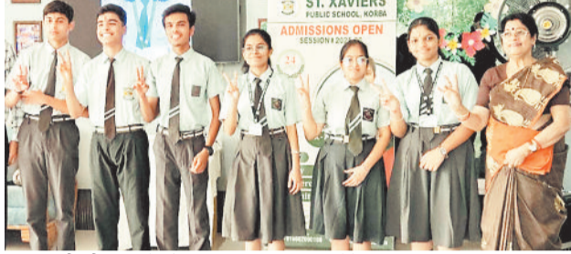
कक्षा 10वीं की छात्राओं को मिठाई खिलाकर बधाई देते हुए।