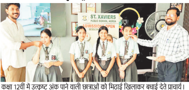
कक्षा 12वीं में उत्कृष्ट अंक पाने वाली छात्राओं को मिठाई खिलाकर बधाई देते प्रचार्य।