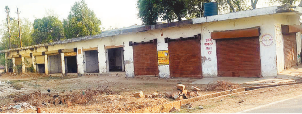
बसने से पहले ही उजड़ गया बाजार शासन के कई करोड़ बर्बाद जिले में बनाई गई थीं सैकड़ों दुकानें