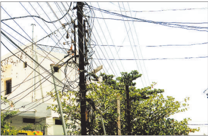
बेतरतीब तारों की वजह से बिजली सप्लाई हो रही है बाधित।

मंगलवार को मिनोचा कालोनी में 15 घंटे तक बिजली बंद रही, सोमवार की रात 11.25 से बंद हुई बिजली अगले दिन 4 बजे के करीब बहाल हो सकी, इस दौरान क्षेत्र में लोगों को पीने का पानी तक नसीब नहीं हो सका। बताया जा रहा है कि रात में प्यूज कॉल को शिकायत करने के बाद भी सुबह 10 बजे तक सप्लाई शुरू नहीं की गई, वहीं 10 बजे के बाद कर्मचारी मरम्मत में जुटे, लेकिन सप्लाई बहाल करने की बजाए नया ट्रांसफार्मर लगाने के लिए मरम्मत के समय को बढ़ा दिया गया। जिसके कारण करीब 15 घंटे तक लोग गर्मी से उबलते रहे। खास बात यह है कि इस दौरान लोगों की शिकायत थी कि नेहरू नगर जोन के अधिकारी लापरवाही और उदासीन रवैया अपनाते रहे, उपभोक्ताओं की शिकायत सुनने के बजाए फोन बंद कर दिया। आभिरकार उपभोक्ताओं ने ईडी एके