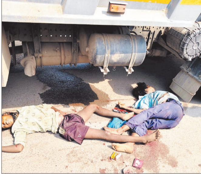
हादसे में मृत युवकों का मौके पर पड़ा शव।